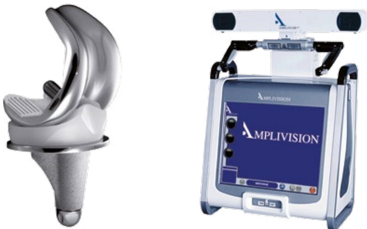
Abb. 1: Amplitude SCORE Knie TEP u. AMPLIVISION Navigationssystem

Die OP-Dauer in der konventionell implantierten Gruppe betrug durchschnittlich 80 \pm 16 Minuten während in der Navigationsgruppe durchschnittlich 111 \pm 17 Minuten benötigt wurden. Nach einem Software Update in 2008 konnte die navigierte OP-Dauer auf 84 \pm 9 Minuten verkürzt werden und lag damit auf