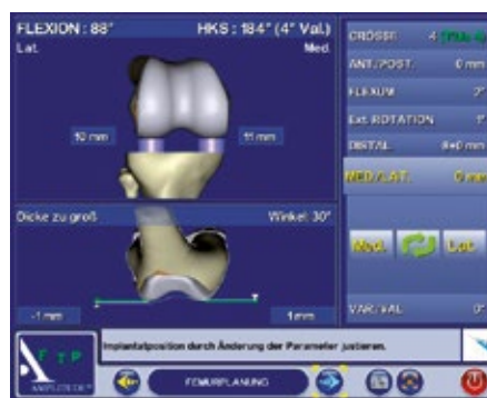
Abb. 3: Femurplanung in Extension und Flexion