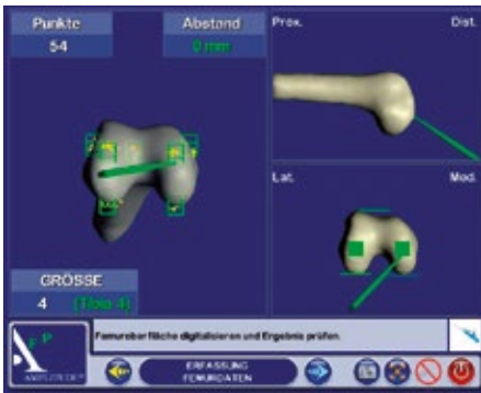
Abb. 2: Digitalisierung Tibia und Femur