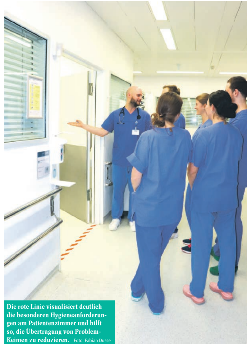
Die rote Linie visualisiert deutlich die besonderen Hygieneanforderungen am Patientenzimmer und hilft so, die Übertragung von Problemkeimen zu reduzieren.

Diese einfache Maßnahme kann Hygieneaspekte durch prägnante Visualisierung stärker hervorheben und Verhaltensweisen positiv beeinflussen. Damit kann ein wirkungsvoller Beitrag geleistet werden, um die Übertragungsraten von multiresistenten Keimen im Krankenhaus zu reduzieren und Patienten zu schützen.