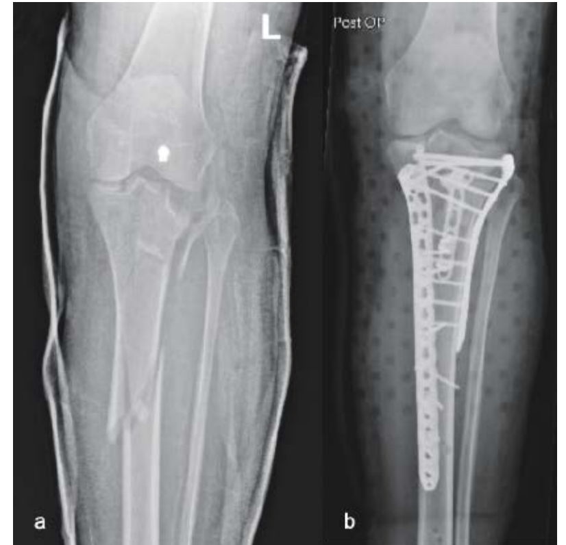
Abb. 2: 67-jährige Patientin mit komplexer proximaler Unterschenkelfraktur nach Sturz mit dem E-Bike; a) präoperative Aufnahme

Zusammenfassend kann gesagt werden, dass die Anspruchshaltung von Best Agern plus hoch ist, dies aber teilweise im Kontrast zur körperlichen Fitness und Knochenqualität steht. Trotz dieser Tatsache kann die Unfallchirurgie durch moderne Implantate, bessere Nachbehandlungsregime und zielgerichtete Empfehlungen zur medikamentösen oder nicht-medikamentösen Prophylaxe dazu beitragen, den hohen Ansprüchen doch zumindest in großen Teilen gerecht zu werden. Best Ager plus profitieren in den allermeisten Fällen nicht von neuen Zentrumsstrukturen wie dem Alterstraumatologischen Zentrum, da sie keine Geriatrie-typischen Symptome aufweisen. Die konservative oder operative