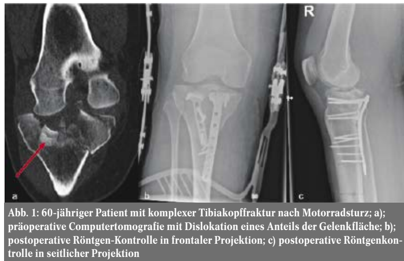
Abb. 1: 60-jähriger Patient mit komplexer Tibiakopffraktur nach Motorradsturz; a); präoperative Computertomografie mit Dislokation eines Anteils der Gelenkfläche; b); postoperative Röntgen-Kontrolle in frontaler Projektion; c) postoperative Röntgenkontrolle in seitlicher Projektion

nachweislich das mittel- und langfristige Therapieergebnis geriatrischer Patienten nach einem Knochenbruch. Durch die Zusammenarbeit von Geriatern, Unfallchirurgen und einem großen nicht-ärztlichen Team wie Physio- und Ergotherapeuten oder speziell geschulten Pflegekräften kann unmittelbar auf die spezifischen Belange dieser Patientengruppe eingegangen werden. Best Ager jedoch profitieren in den allermeisten Fällen nicht von diesen spezialisierten Einrichtungen, da sie die Einschlusskriterien in Bezug auf das Alter oder die Multimorbidität nicht erfüllen.